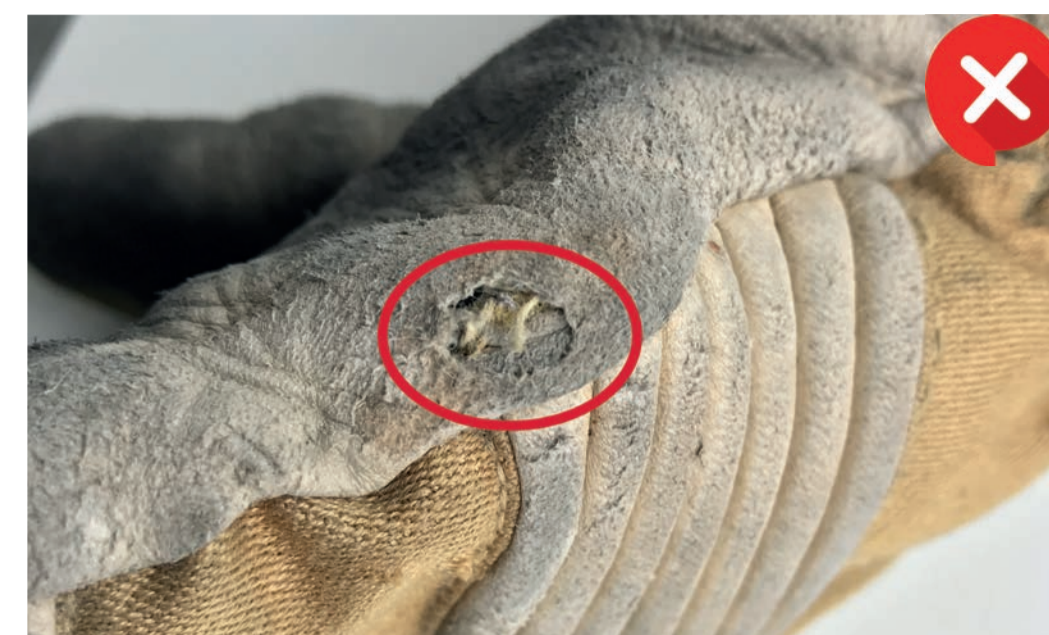
Loch durch Abrieb